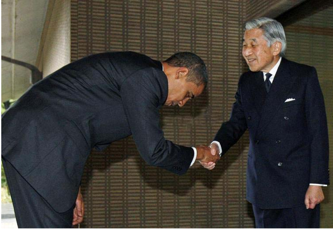
奥巴马访问日本 与天皇见面

9 摩西、亞倫、拿答、亞比戶，并以色列長老中的七十人，都上了山。 10 他們看見以色列的神，他脚下彷彿有平鋪的藍寶石，如同天色明淨。 11 他的手不加害在以色列的尊者身上。他們觀看( Behold, Wow! )神；他們又吃又喝。