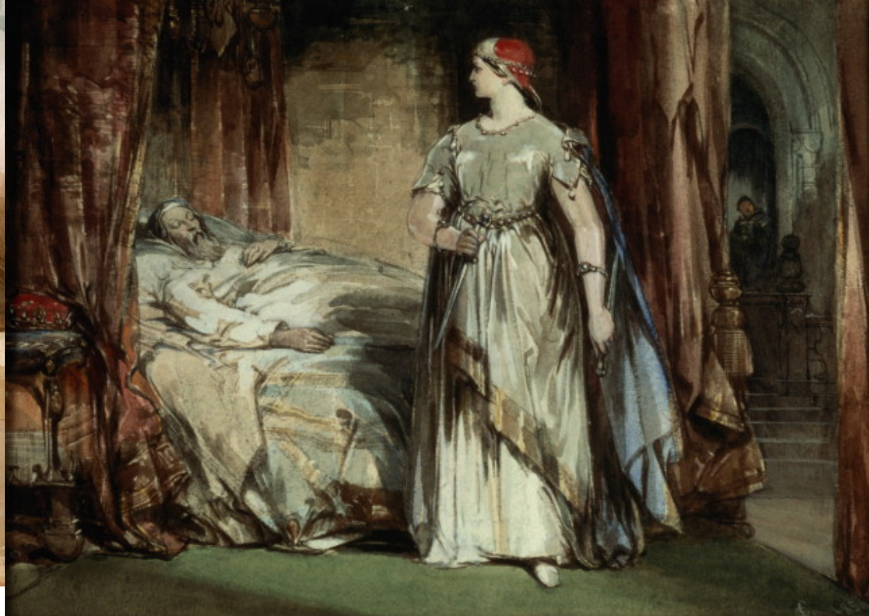
麦克白夫人手上的罪迹