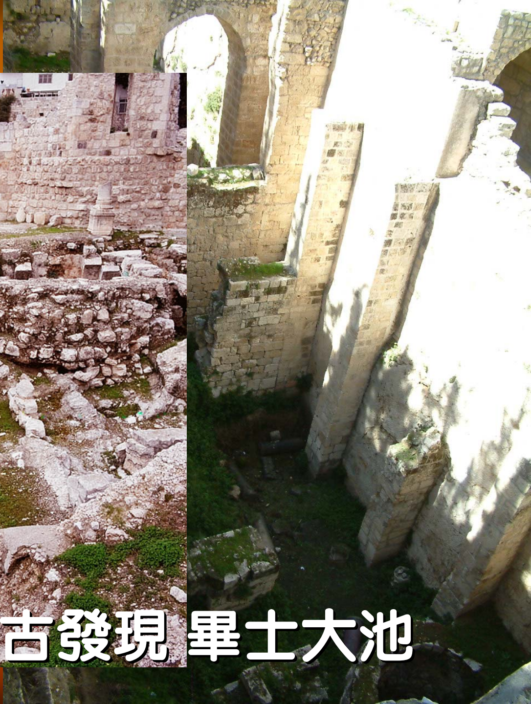
考古發現 畢士大池