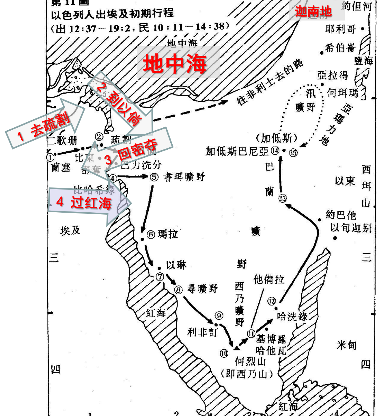
第 11 圖 以色列人出埃及初期行程 (出 12:37—19:2, 民 10:11—14:38)